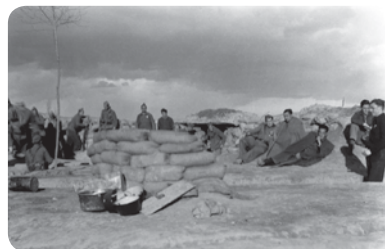
↑ Fuerzas nacionales atrincheradas

La característica más sobresaliente es su trazado en zig-zag , que protegía a los soldados del ametrallamiento aéreo. El mismo trazado se aprecia en las salidas al frente que desde el parapeto exterior de la trinchera se extienden por toda la ladera.