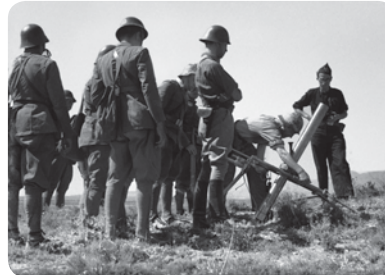
↑ Artillería del ejército nacional

Las cuevas , con una o dos entradas y galerías interiores, se excavaron como refugio, vivienda y también como almacén, polvorín, puesto de mando y de socorro.