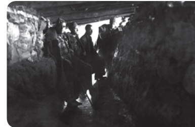
↑ Trinchera cubierta. Fototeca de Huesca