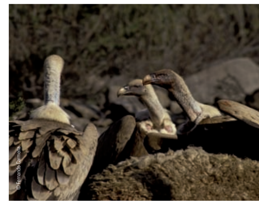
↑ Buitres dando buena cuenta de un cadáver de oveja.

Son lugares vallados y controlados por la Administración donde se suministra con regularidad restos de mataderos