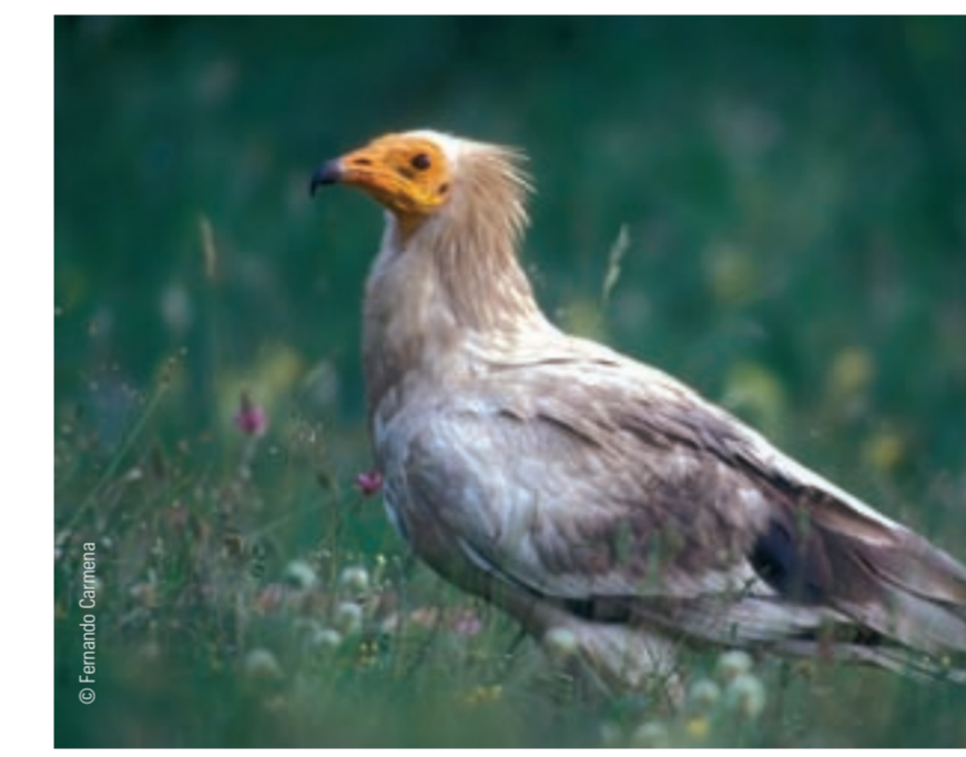
↑ El alimoche pasa el verano en los mallos y el invierno en África.

El primero en llegar suele ser el buitre leonado, el único capaz de abrir un cadáver con su fuerte pico. Luego van llegando los alimoche, milanos, cuervos y cornejas. El último en intervenir es el quebrantahuesos, porque se alimenta únicamente de huesos. Pequeñas aves como la lavandera blanca, y ocasionalmente algún zorro, llegan cuando las grandes carroñeras se han ido.