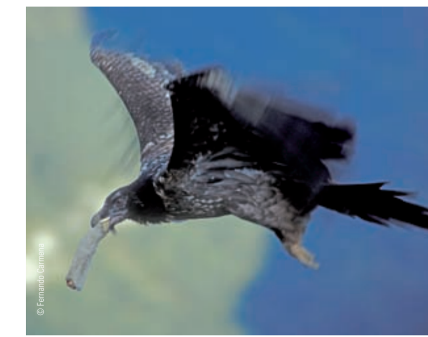
↑ Un quebrantahuesos joven echa a volar con su comida.

Una vez que llegan los buitres leonados la mayor parte del animal muerto desaparece en cuestión de minutos. Para las otras aves sólo quedan pequeños restos y huesos. ¡Los buitres se llenan tanto al comer que a veces no pueden ni levantar el vuelo!