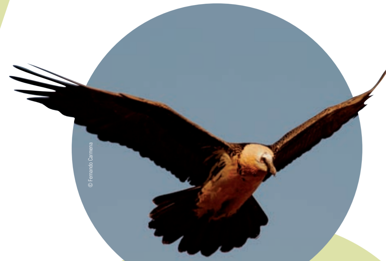
↑ El majestuoso quebrantahuesos.

Las enormes paredes de conglomerado que se alzan sobre los pueblos de Riglos y Agüero se denominan localmente mallos . Son el límite natural entre el Pirineo y el valle del Ebro, y tienen un extraordinario interés ornitológico durante todo el año. Aquí abundan las aves carroñeras, ya que los mallos les ofrecen un lugar seguro para anidar y el ganado del llano les proporciona alimento. En la zona también encontraremos otras especies interesantes como el treparriscos y multitud de aves pequeñas.