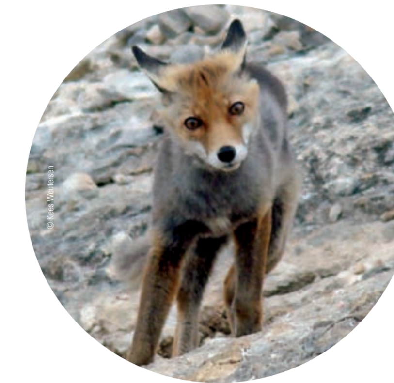
↑ Un zorrillo se acerca al muladar.