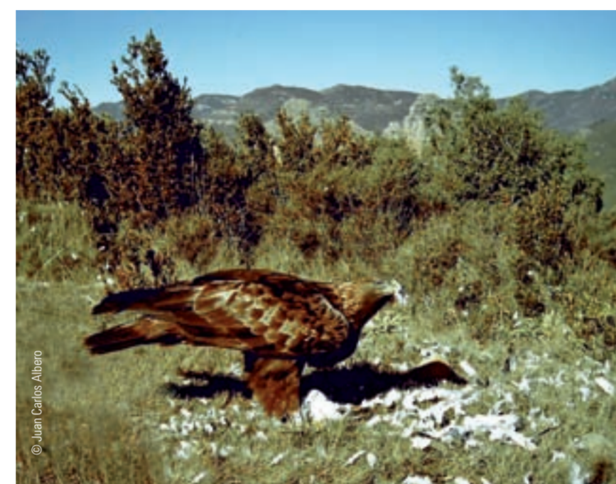
↑ Águila real.

Las aves que se alimentan de los restos que encuentran de animales muertos, tanto de animales silvestres (ciervos, jabalíes) como de ganado (ovejas, cabras, vacas, etc.).