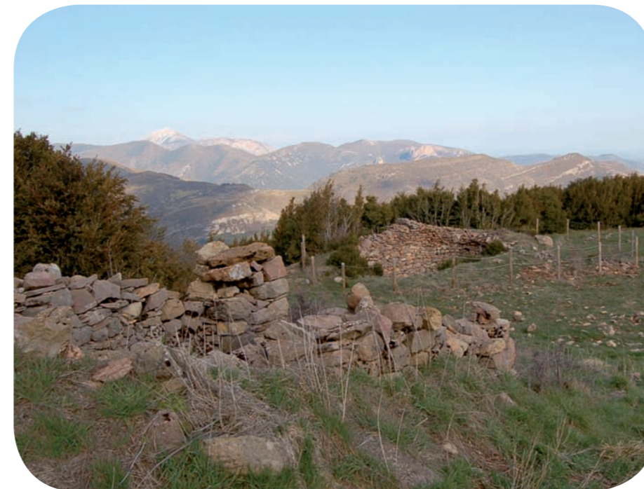
↑ Caseta de labor situada en las proximidades de Calmas IV (Nueno).

El nevero tiene planta circular y sus paredes están elaboradas en mampostería aparejada en seco. En la parte superior se observa el arranque de una posible falsa bóveda por aproximación de hiladas que cubriría el pozo.