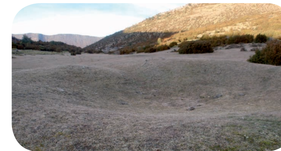
↑ Lugar donde se ubicaría Mata Menuda II.

Su forma interior es cónica, con una profundidad de algo más de 1 m en su parte central.