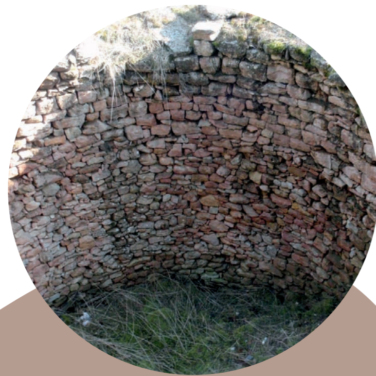
↑ Detalle del aparejo del pozo.