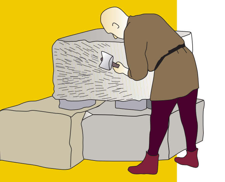
↑ Cantero o picapedrero

Estas marcas que aparecen en el pozo de Vicién eran la firma grabada a piedra de quien la tallaba, a modo de símbolo, para indicar que el trabajo era suyo y de esta forma cobrar por la cantidad de piedras labradas. Letras y figuras geométricas son los signos que predominan en las piedras de Vicién.