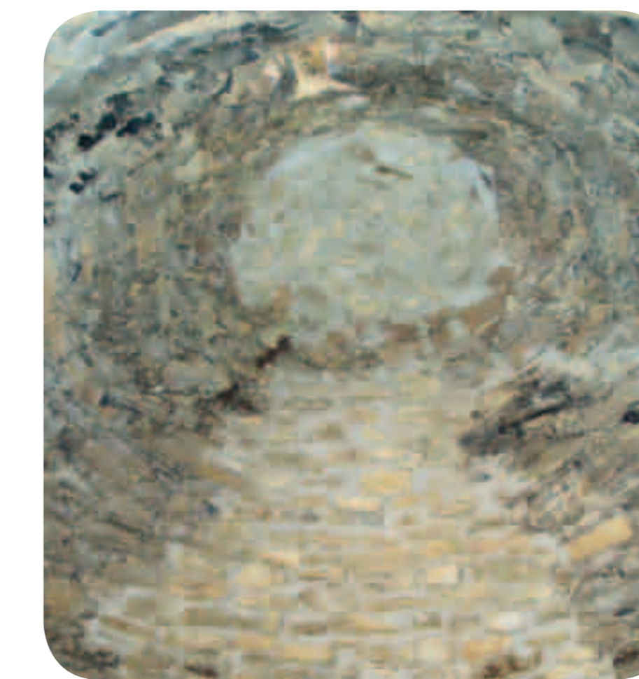
↑ Casbas de Huesca