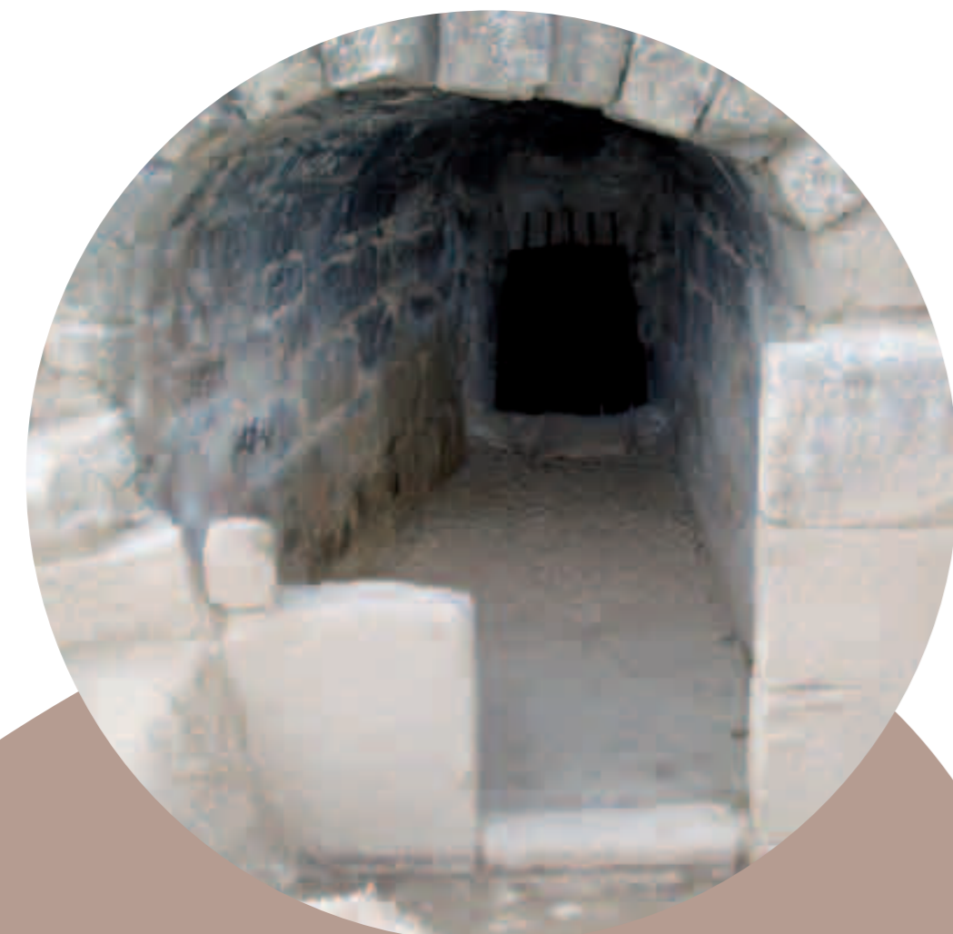
↑ Parte superior del pozo de Vicién.

Los pozos de hielo reciben numerosas denominaciones dependiendo del lugar donde se encuentran: fresqueras, pozos neveros, pozos de yelo o de chelo, pocicos, neveretas, etc. Pero su utilidad ha sido siempre la misma, suministrar nieve y hielo a la población. En Vicién la materia prima predominante para el llenado del pozo sería el hielo. Una acequia cercana proporcionaba el agua necesaria para su almacenaje en unas «balsas de congelación» preparadas al efecto.