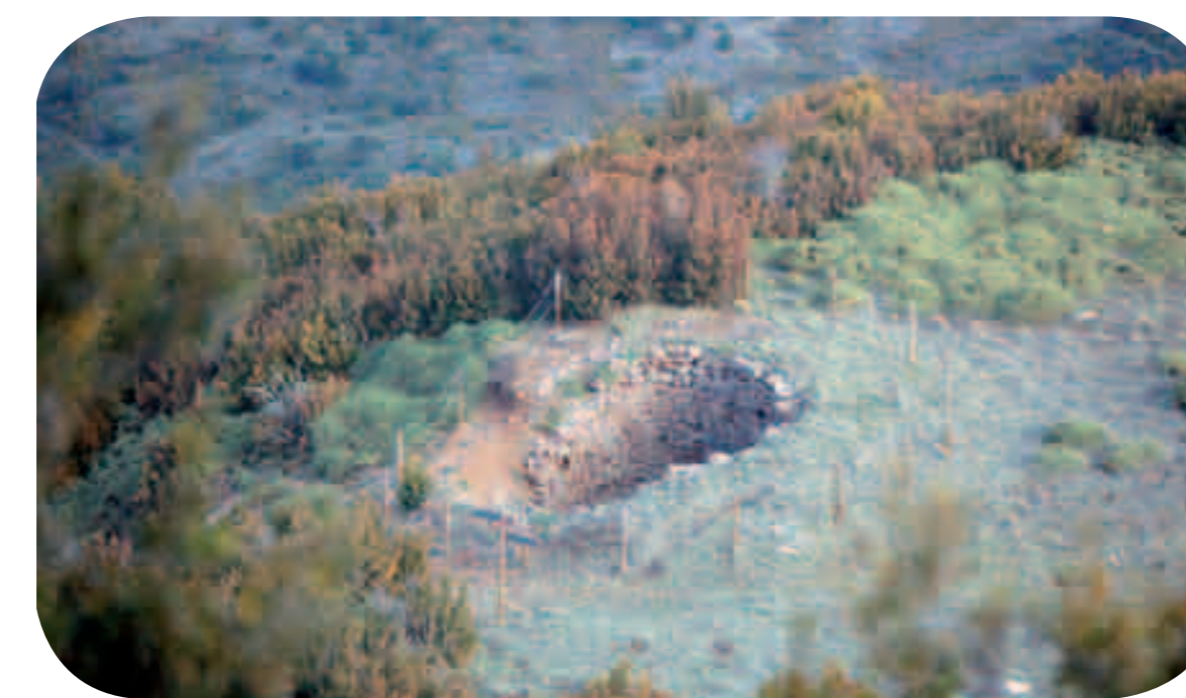
↑ Pozo de Las Calmas (Nueno)

En Casbas de Huesca el pozo se edificó con piedras sin labrar y su cubierta es una falsa cúpula colocada a piedra seca por aproximación de hiladas.