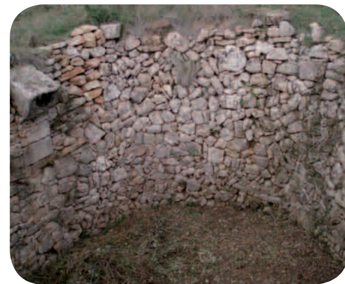
↑ Pozo de Cuello Bail (Loporzano)

Sus cubiertas son poco conocidas y algunos pozos tuvieron techo abovedado mientras que otros se cerraban únicamente con ramas y tablones y se sellaban con lajas de piedra.